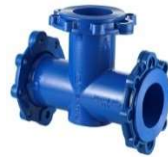
tee flangiato in ghisa