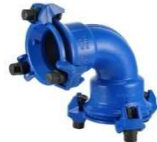
curva a doppio bicchiere a 90° - 1/4