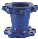
riduzione flangiata in ghisa